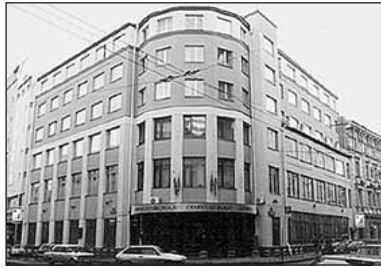
24 октября 2007 года во втором чтении принят законопроект «О бюджете города Москвы на 2008 год».