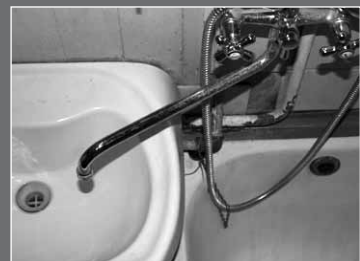
ГРАФИК ОТКЛЮЧЕНИЯ ГОРЯЧЕЙ ВОДЫ