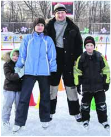
Три серебряные медали

В Северном округе на стадионе "Кронштадские крюки" прошли соревнования спортивных семей "Зимние забавы" в рамках московской спартакиады "Всей семьей за здоровьем". Мамы, папы и детки с Сокола приняли активное участие в состязании и привезли домой три вторых места.