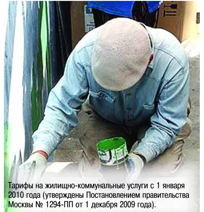
Тарифы на жилищно-коммунальные услуги с 1 января 2010 года (утверждены Постановлением правительства Москвы № 1294-ПП от 1 декабря 2009 года).

Как объясняют в ГУ "Инженерная служба района Сокол" это не значит, что именно такие суммы появятся в платежках. Это стандарты, исходя из которых определяется размер субсидий, поэтому при повышении цен на услуги автоматически растут и субсидии.