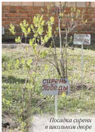
Посадка сирени в школьном дворе

В 1955 году на Соколе открылась школа № 739. И все эти годы она находится в центре всех процессов, происходящих в отечественном образовании. С 2003 года школа работает в режиме «Полного дня». Созданы все условия для развития своих творческих способностей ребят, их отдыха во второй половине дня, дополнительных занятий с педагогами и занятий по интересам. В школе широко развита