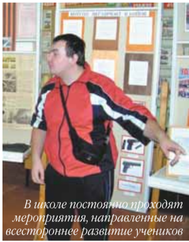
В школе постоянно проходят мероприятия, направленные на всестороннее развитие учеников

Много сил приходится прикладывать опытным специалистам школы, среди которых учителя-дефектологи высшей категории с многолетним стажем работы, психологи, логопеды, социальные педагоги, чтобы пробудить у ребенка интерес к знаниям, социализировать его и дать начальную профессиональную подготовку.