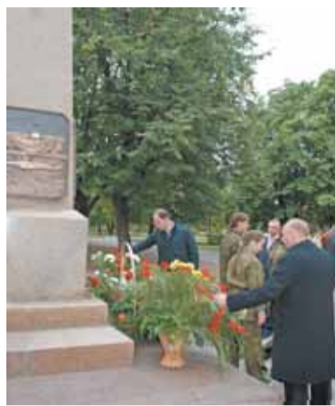
Префект САО Олег Митволь 4 сентября возложил венок к памятнику на Коптевском бульваре