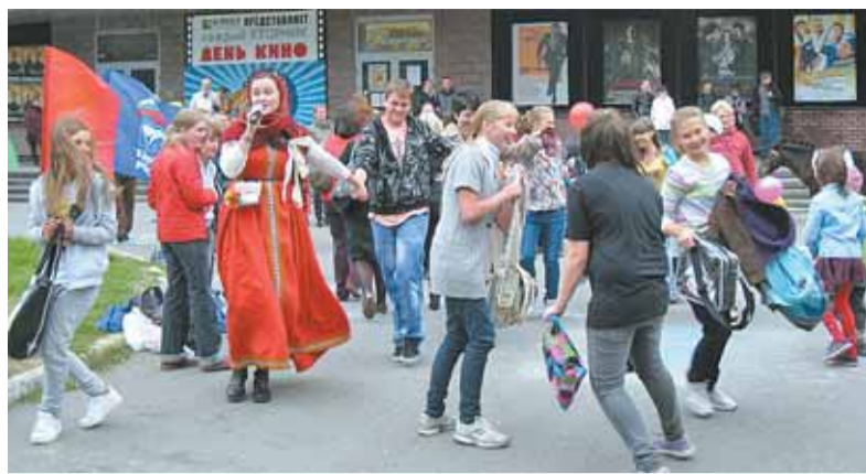
На площадке у кинотеатра «Ленинград» в День города было много молодежи