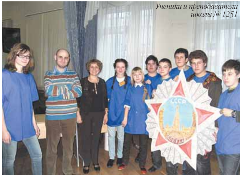
Ученики и преподаватели школы № 1251