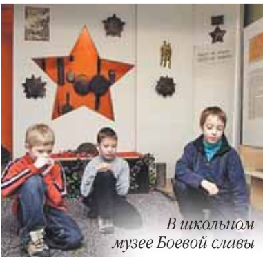
В школьном музее Боевой славы

Новым для ребят стал «Фестиваль национальных культур». Учащиеся школы посетили посольство в «День польского языка», где школьники смогли познакомиться с некоторыми аспектами польской культуры. Ответным мероприятием стал «День русского фольклора». Школьная театральная студия