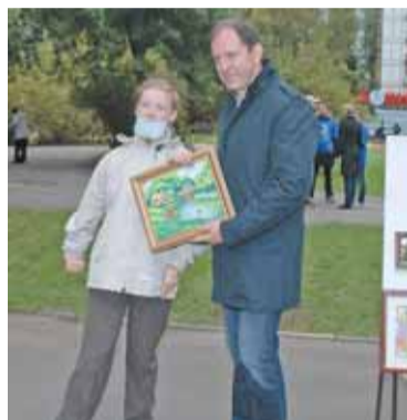
На окружном празднике по случаю Дня города префект САО познакомился с творчеством местной художницы — девушки с ограниченными возможностями здоровья