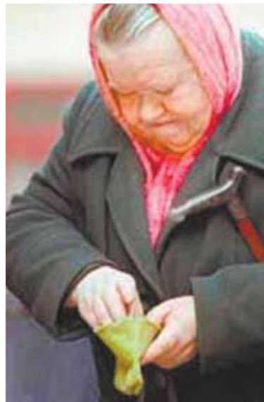
По информации пресс-службы ГЦЖС

Для оформления субсидии на оплату жилого помещения и коммунальных услуг необходимо обратиться в районный отдел жилищных субсидий и представить пакет документов.